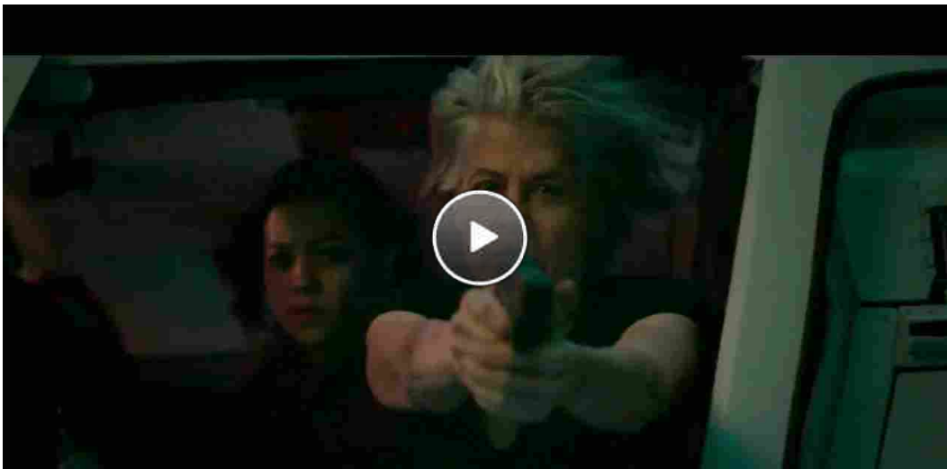
Terminator: Destino Oscuro Il Nuovo Trailer Ufficiale Italiano del Film - HD

Giovedì 3 ottobre, in un incontro al Padiglione 8, il pubblico potrà indagare sul Romics Innovation Lab for Creativity , rivolto agli attori dell'innovazione creativa romana e italiana. Saranno lì annunciati alcune delle prime attività in programma tra la fine di quest'anno e l'inizio del prossimo.