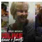
Romics 2019 - Diabolike: Donne e fumetto