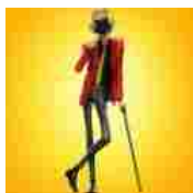
Lupin III - The First: verrà presentato in italiano in anteprima al Romics