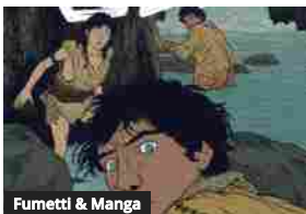
Fumetti & Manga Il sentiero delle ossa, un viaggio alla scoperta della preistoria