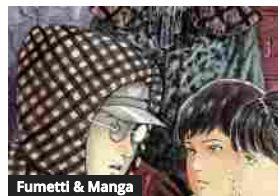
Fumetti & Manga J-Pop ha grandi novità per la seconda metà di Settembre: torna il maestro Junji Ito, e molto altro!