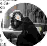
ISABELLE ADJANI, 64 ANNI, AL TEATRO ARGENTINA DAL 27 AL 29 CON LO SHOW "OPENING NIGHT"

► Teatro Argentina, largo di Torre Argentina 52 27 - 29 settembre, ore 21