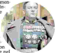
UN'IMMAGINE DEL FILM "MORTO STALIN SE NE FA UN ALTRO" DI ARMANDO IANNUCCI