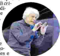
MICHELE PLACIDO, 73 ANNI, AL QUIRINO CON IL SUO NUOVO SHOW "PICCOLI CRIMINI QUOTIDIANI"

► Teatro Quirino, via delle Vergini 7. Da martedì 1 ottobre ore 21