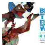
Romics 2019 - Blood Type: Blue Water, ovvero il rapporto tra Evangelion e Nadia?