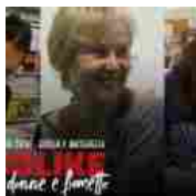
Romics 2019 - Diabolike: Donne e fumetto